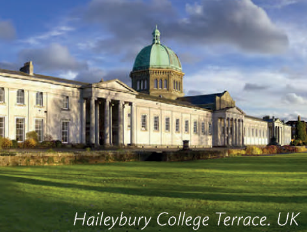
Haileybury College Terrace. UK